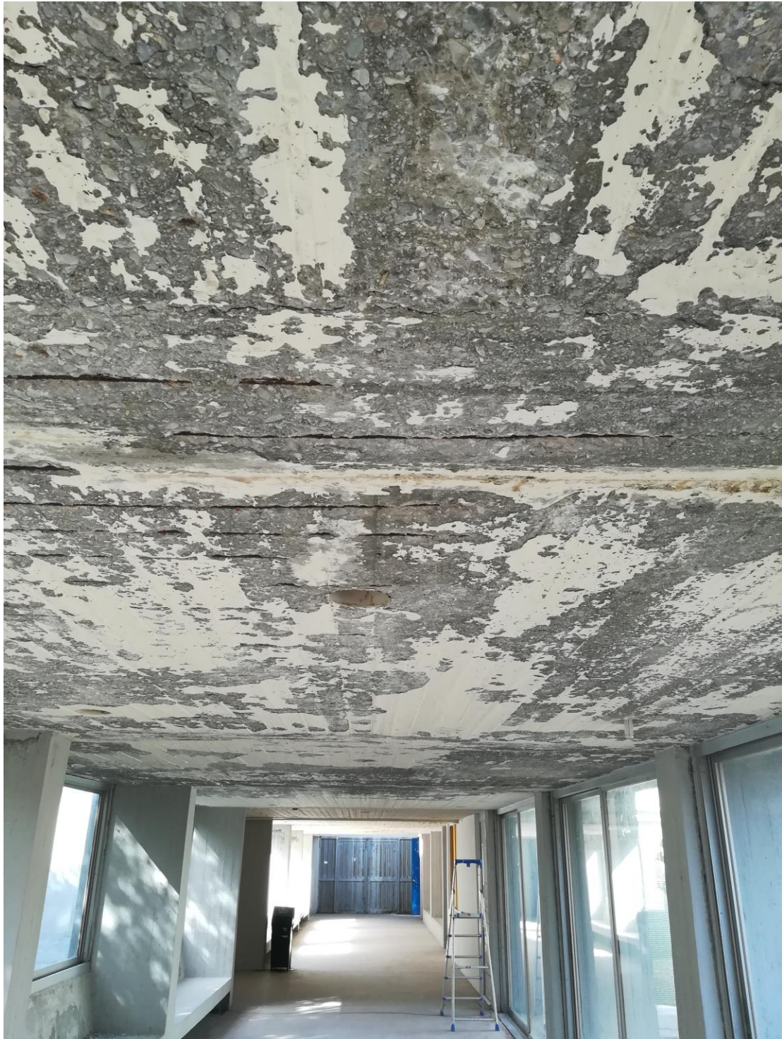
Ο διάδρομος που οδηγούσε στο αμφιθέατρο του Τμήματος Κοινωνικής Θεολογίας και Θρησκευολογίας ΠΡΙΝ.

Η διαβρωμένη σε πολλά σημεία από την υγρασία οροφή επισκευάστηκε και βάφτηκε λευκή για να φωτίσει το μέχρι πρότινος γκρίζο εσωτερικό τοπίο, ενώ το ίδιο εφαρμόστηκε και στους τοίχους του ορόφου.