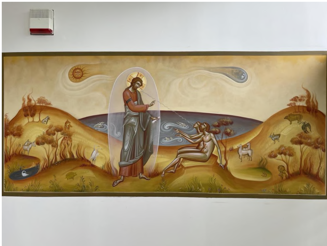
Η Δημιουργία δεξιά της εισόδου της Γραμματείας.