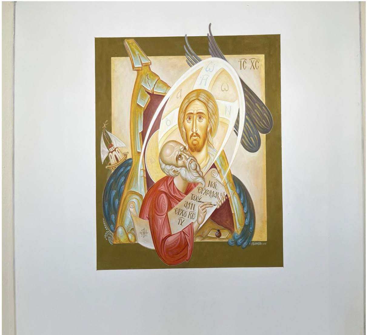
Η αγιογραφία με τον Αγ. Ιωάννη τον Θεολόγο και τον Ιησού Χριστό υποδέχεται τον επισκέπτη στην κάτω είσοδο της Θεολογικής Σχολής του ΕΚΠΑ.