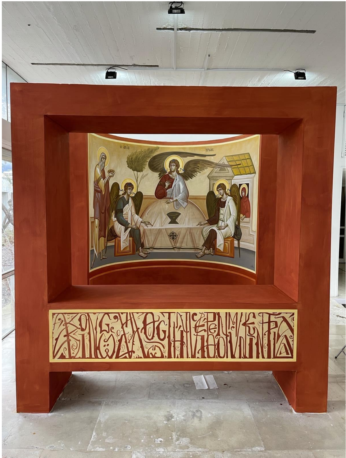
Η παράσταση με την φιλοξενία του Αβραάμ στην κόγχη, στο αίθριο προ της Γραμματείας.