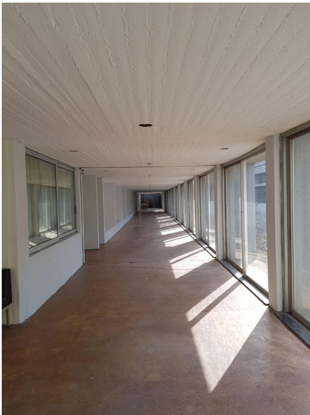
Ο διάδρομος που οδηγεί στο Β΄ Αμφιθέατρο πλήρως ανακαινισμένος.