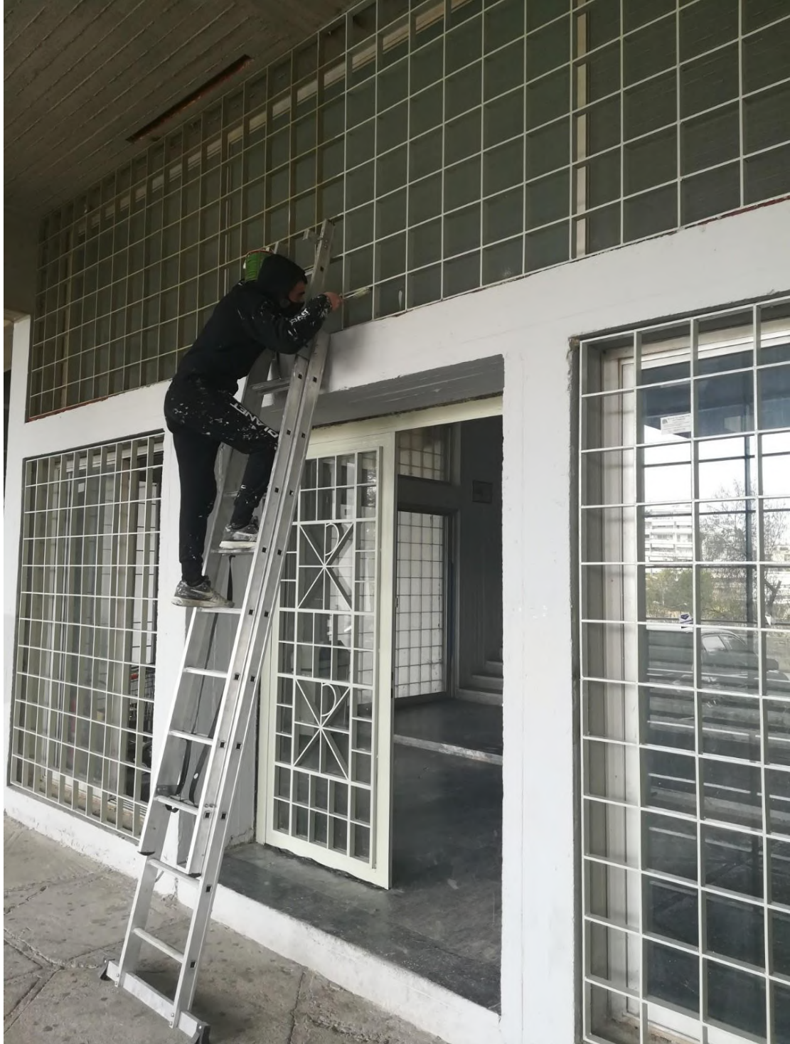
Στιγμιότυπο από την ανακαίνιση της κάτω εισόδου της Σχολής.

Σειρά είχαν πλέον οι εξωτερικές προσόψεις των δύο εισόδων της Σχολής, οι οποίες είχαν διαβρωθεί από την υγρασία και «διακοσμηθεί» με γκράφιτι, αλλοιώνοντας το χαρακτήρα και την εικόνα της Σχολής.