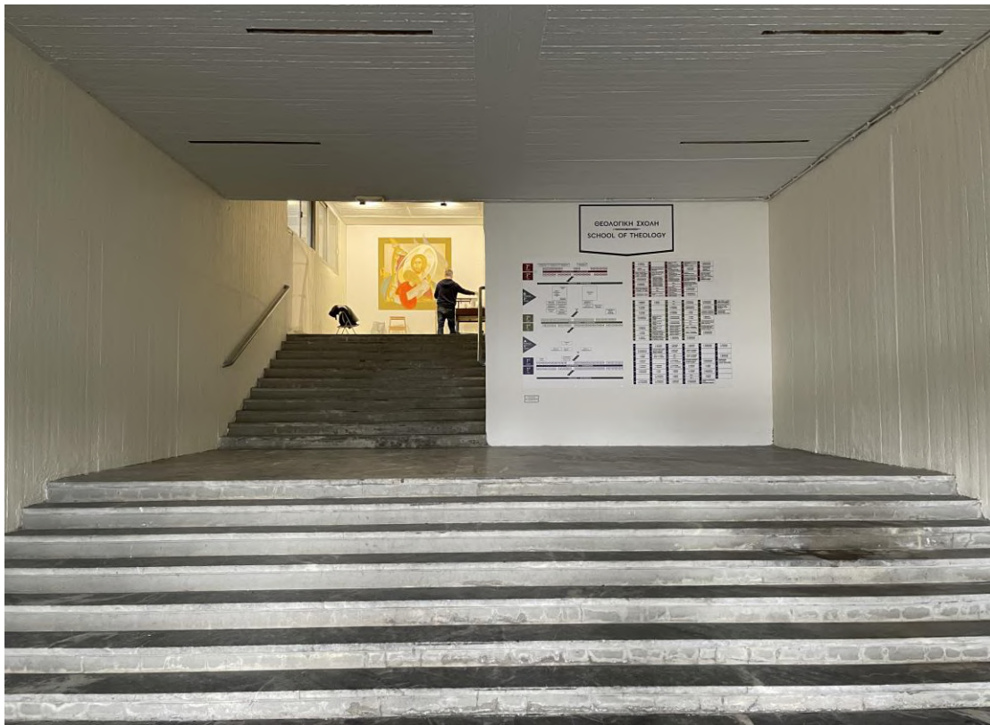
Η κάτω είσοδος της Σχολής.

Ανάλογες παρεμβάσεις με τοποθέτηση γυψοσανίδων, αποκατάσταση οροφών και επιχρωμάτωση πραγματοποιήθηκαν και στις δύο κεντρικές εισόδους της Σχολής, τόσο σε εκείνη του 2 ου ορόφου όσο και σε εκείνη με τον ανελκυστήρα.