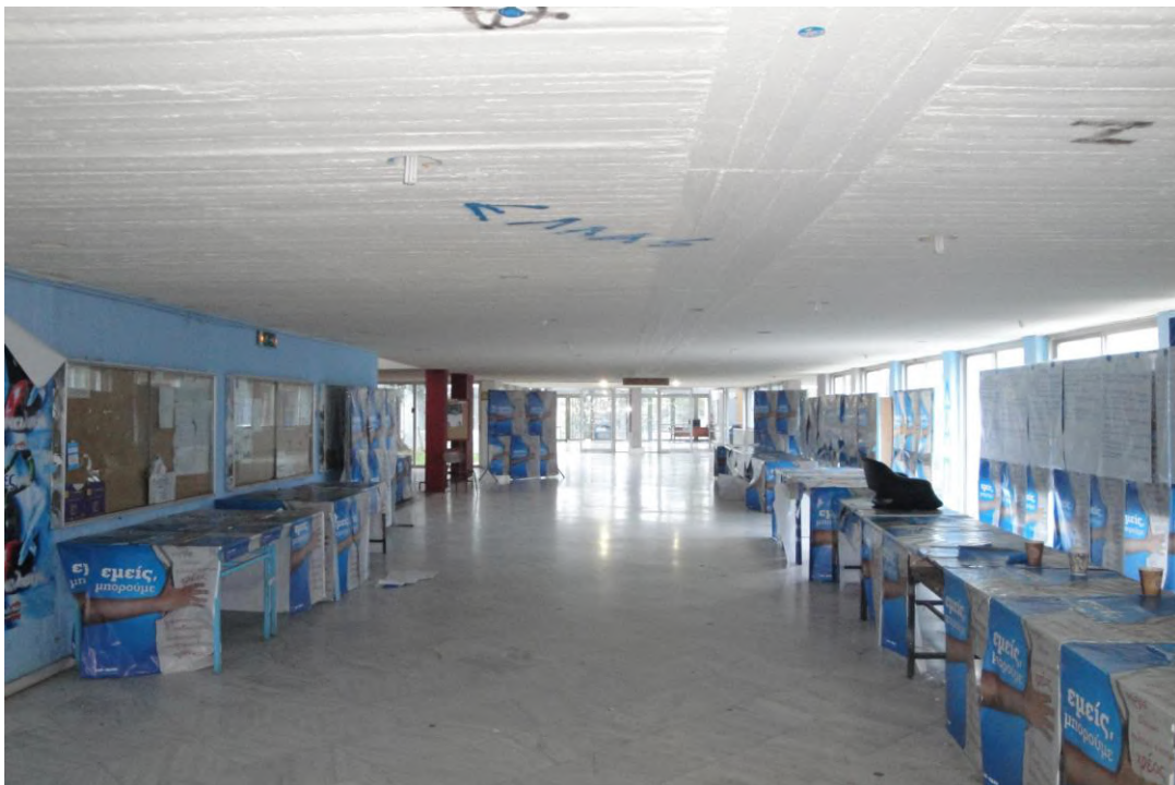
Ο κεντρικός διάδρομος ΠΙΠΝ.