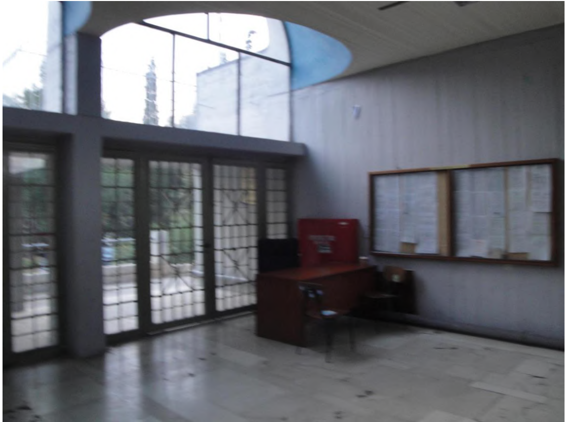
Η επιφάνεια παραπλεύρως της Βιβλιοθήκης ΠΡΙΝ.