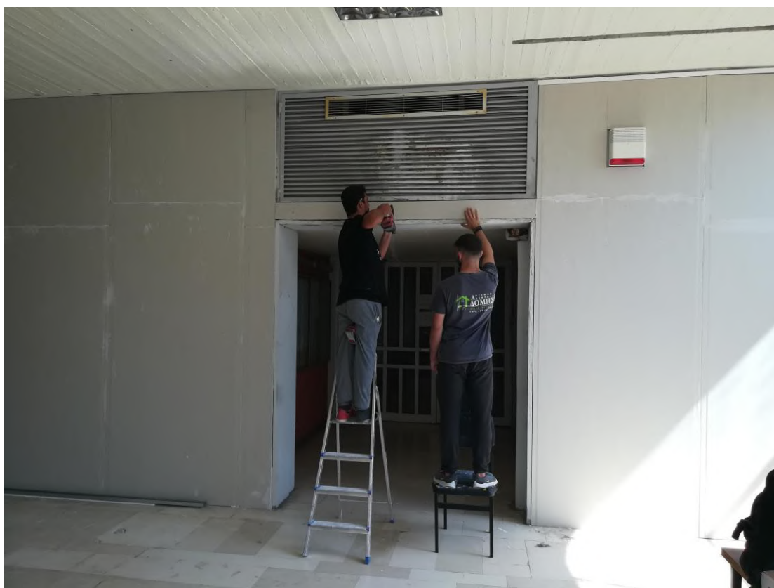
Στιγμιότυπο από τις εργασίες στο αίθριο προ της Γραμματείας.