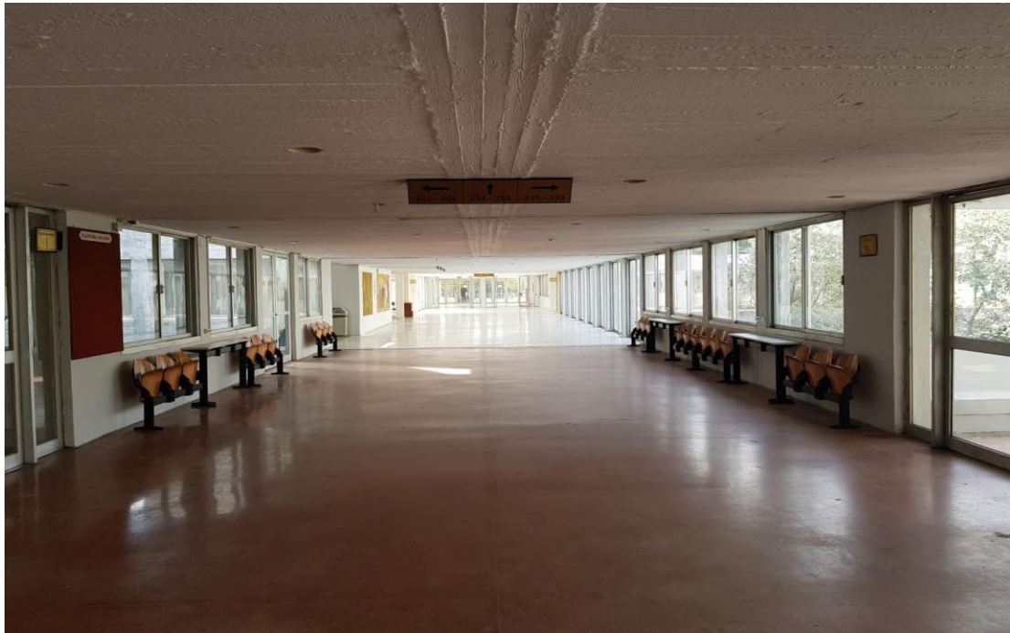
Τα ανακλινόμενα καθίσματα έξω από το Κεντρικό Αμφιθέατρο.

ρεύματος με σκοπό την εξυπηρέτηση των ακροατών των μαθημάτων και την διευκόλυνσή τους στη φόρτιση των ηλεκτρονικών συσκευών τους (κινητά τηλέφωνα, laptop, tablet). Επιπλέον ενισχύθηκε με δύο πρίζες το wi-fi, έτσι ώστε να καταστεί απρόσκοπτη η αξιοποίηση των δυνατοτήτων του διαδικτύου.