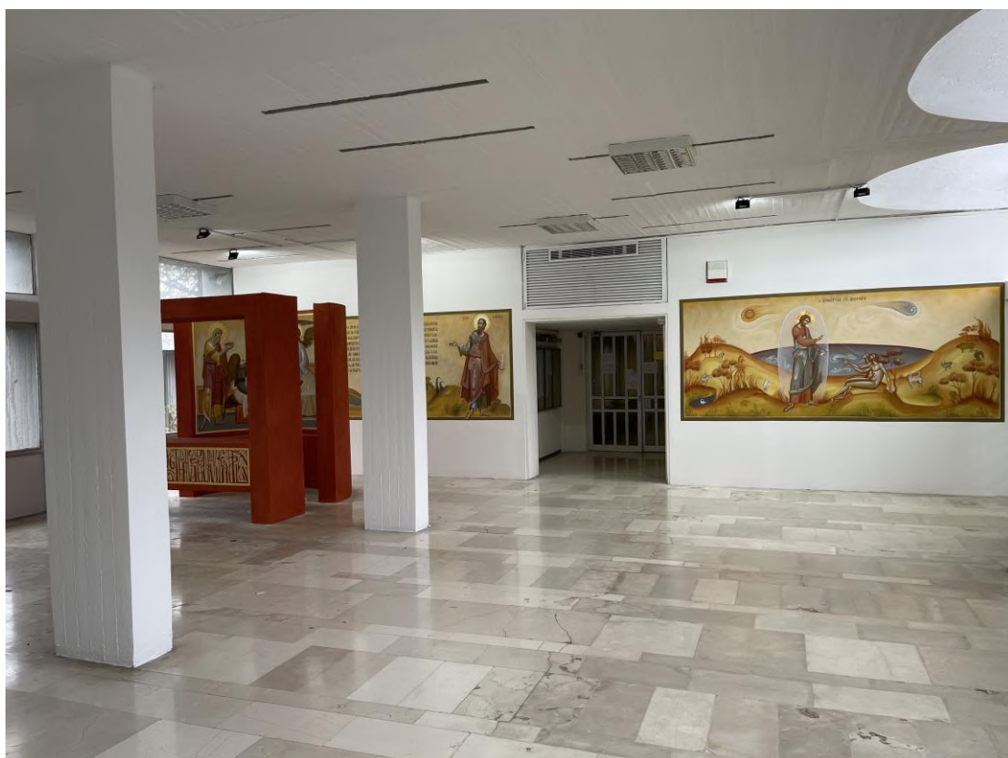
Η άνω είσοδος της Σχολής, μπροστά από τη Γραμματεία και τη Βιβλιοθήκη, ΤΩΡΑ.