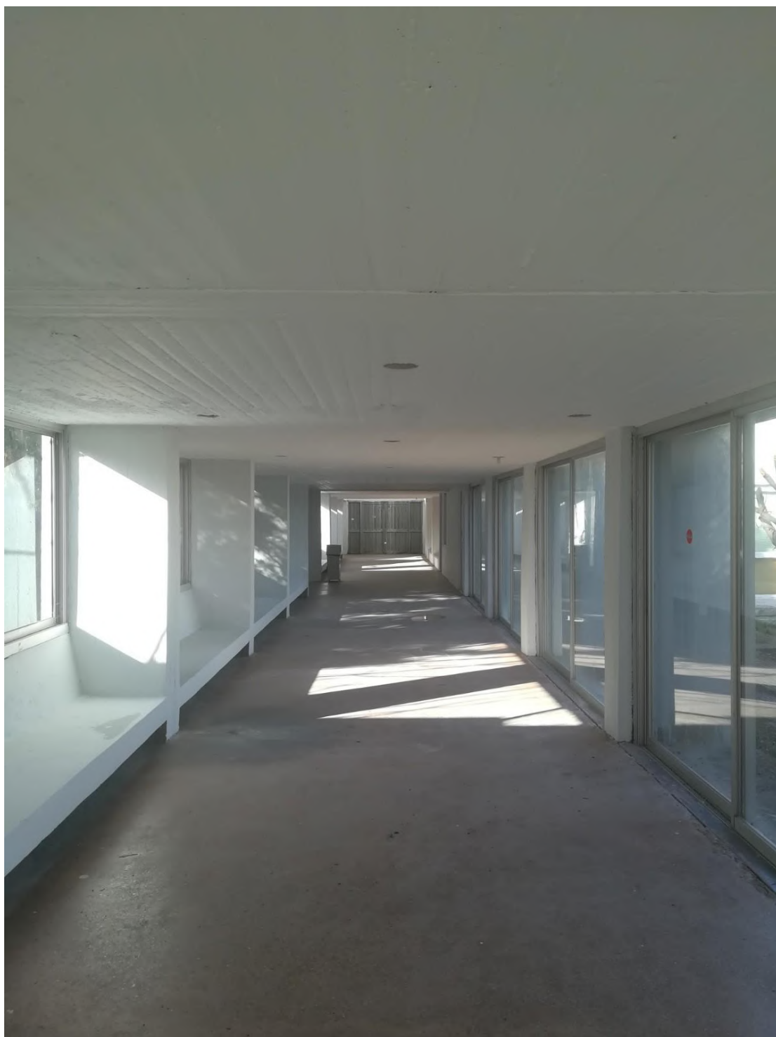
Ο διάδρομος προς το Αμφιθέατρο του Τμήματος Κοινωνικής Θεολογίας και Θρησκευολογίας ΤΩΡΑ.