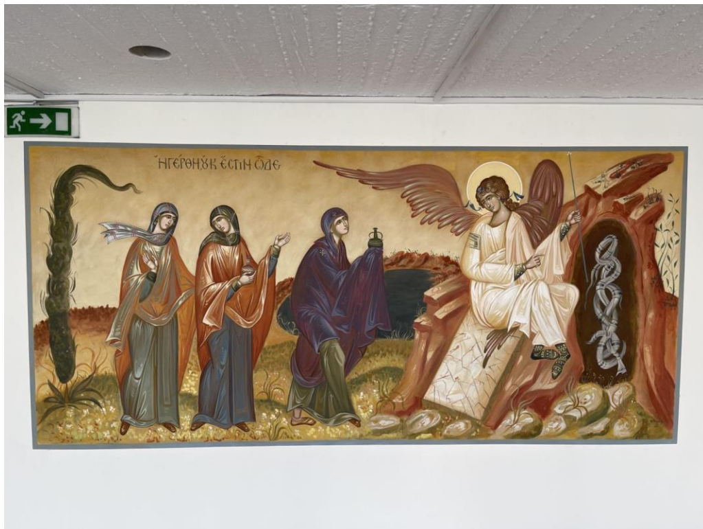
Η παράσταση με την προσέλευση των μυροφόρων επί του κενού μνήματος.

Δύο σειρές από αχρησιμοποίητα ανακλινόμενα καθίσματα τοποθετήθηκαν μπροστά από το Κεντρικό Αμφιθέατρο, συνοδευόμενα από μικρά έδρανα και παροχές