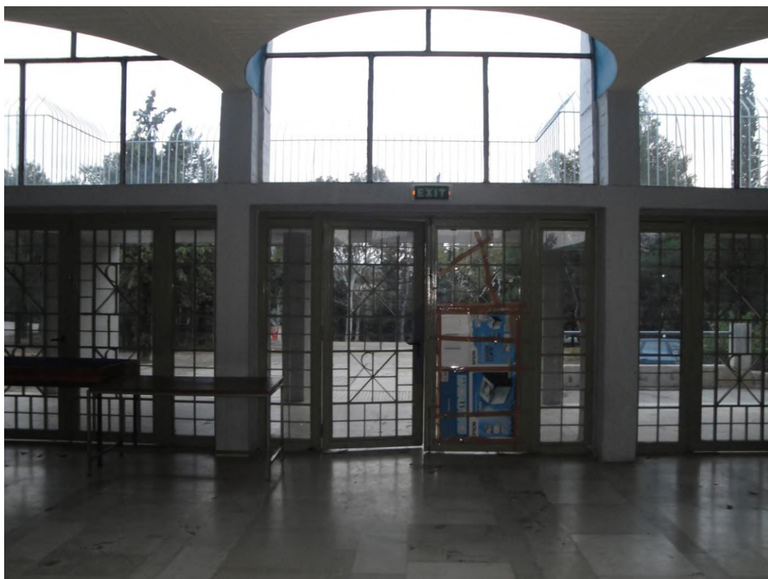
Η κεντρική (άνω) είσοδος της Σχολής ΠΙΠΙΝ.