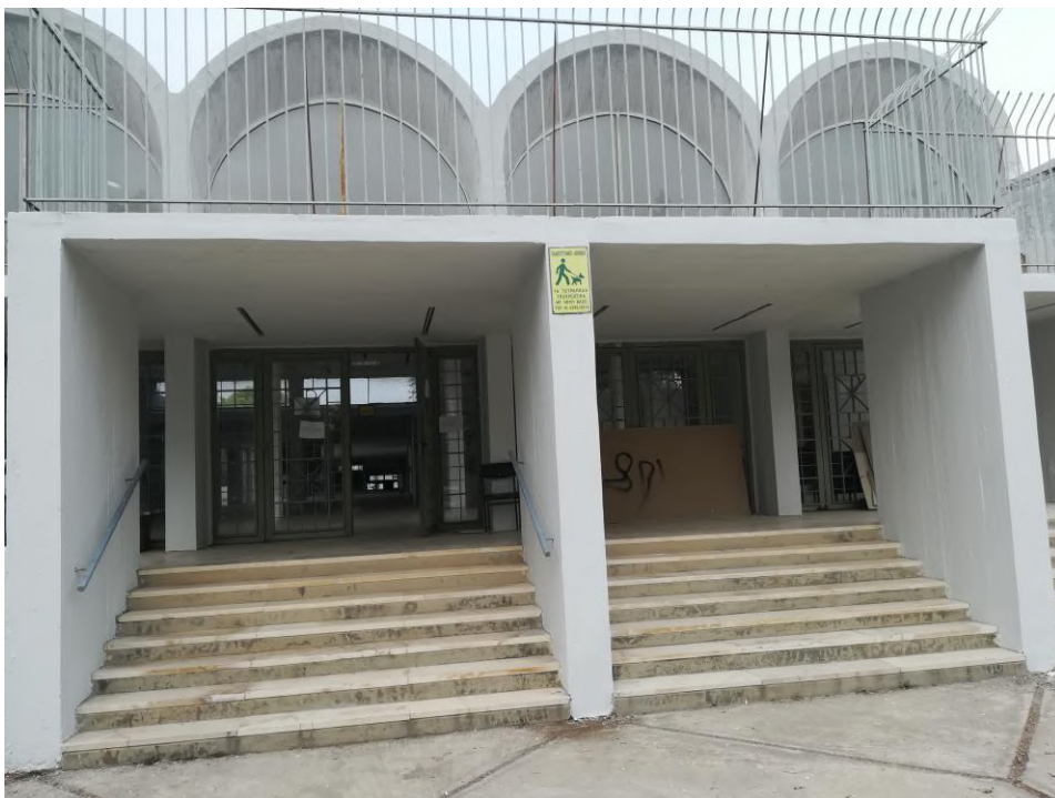
Η κεντρική είσοδος της Σχολής ΤΩΡΑ.