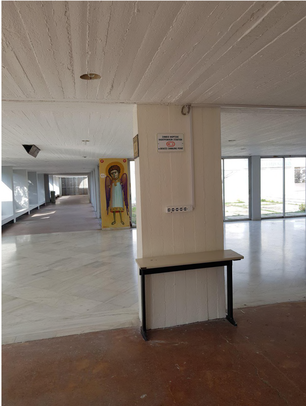
Ένα από τα πολλά πλέον σημεία, έξω από τα αμφιθέατρα του 2 ου ορόφου, όπου ο επισκέπτης φορτίζει με άνεση τις ηλεκτρονικές συσκευές του.