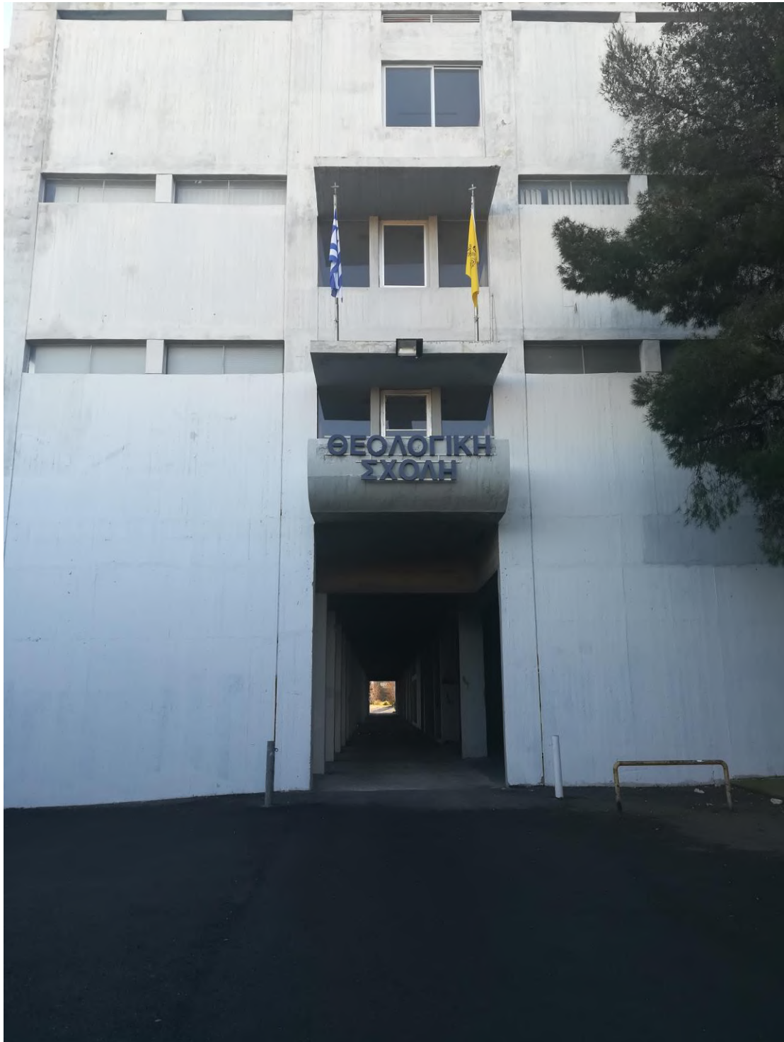
Η εξωτερική είσοδος στη Σχολή, εξωραϊσμένη με την ανακατασκευασμένη επιγραφή.

Στην κάτω είσοδο βάρφηκε η μεγάλη πρόσοψη και αφού επισκευάσθηκε η μεγάλη επιγραφή με την ένδειξη ΘΕΟΛΟΓΙΚΗ ΣΧΟΛΗ μεταφέρθηκε από την πλαϊνή τοιχοποιία (αριστερά) στο μέσον, στο μπαλκόνι, έτσι ώστε να είναι πλέον ορατή στον επισκέπτη, που αντικρίζει το κτήριο από την κεντρική οδό.