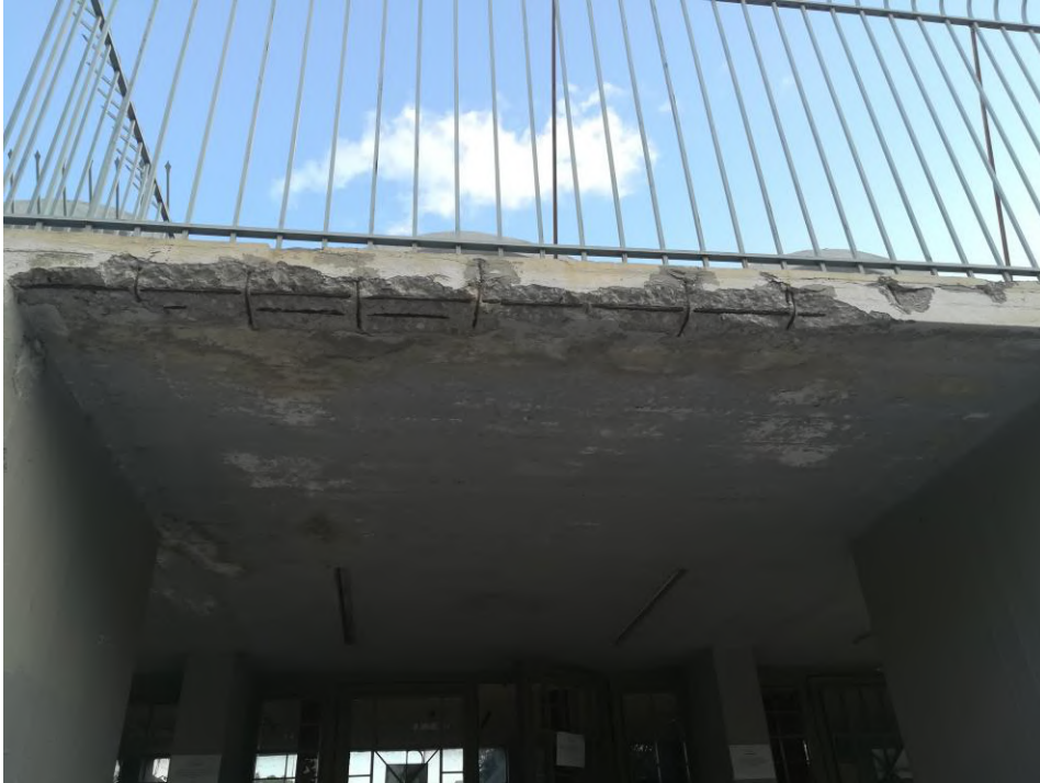
Η κεντρική είσοδος της Σχολής ΠΙΠΙΝ.

Στην άνω – κυρία είσοδο, αποκαταστάθηκαν τα επικίνδυνα – διαβρωμένα από την υγρασία στηθαία της πρόσοψης και στη συνέχεια βάφτηκαν. Νέα μεγάλη επιγραφή με την ένδειξη ΘΕΟΛΟΓΙΚΗ ΣΧΟΛΗ – SCHOOL OF THEOLOGY έχει παραγγελθεί και θα τοποθετηθεί τις επόμενες ημέρες στην πρόσοψη και της άνω – κυρίας εισόδου για να πληροφορεί τον επισκέπτη για την ταυτότητα του κτηρίου.