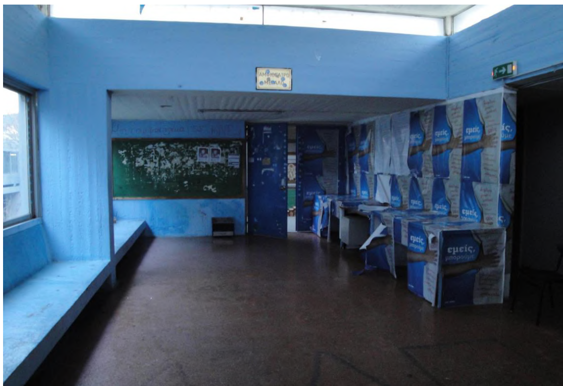
Η είσοδος στο Κεντρικό Αμφιθέατρο ΠΙΡΙΝ.