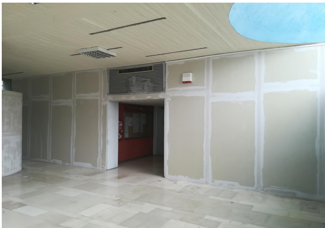
Η κάλυψη με γυψοσανίδες των επιφανειών εκατέρωθεν της Γραμματείας από την Τεχνική Υπηρεσία του ΕΚΠΑ προκειμένου να αγιογραφηθούν.