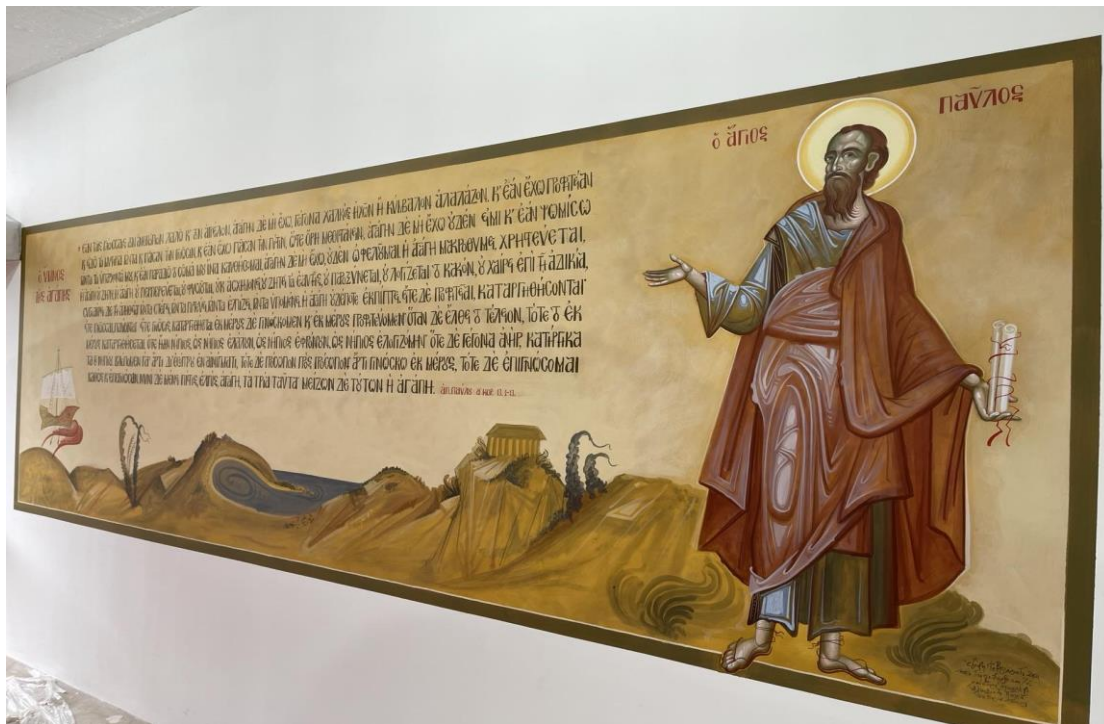
Ο Απ. Παύλος αριστερά της Γραμματείας.