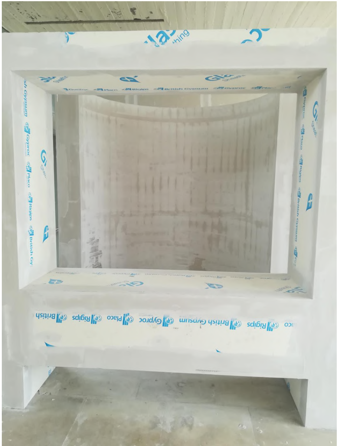
Η προετοιμασία της κόγχης από την Τεχνική Υπηρεσία του ΕΚΠΑ.