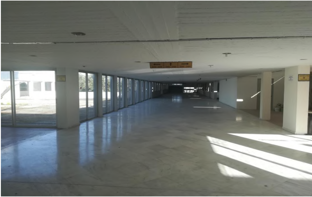
Ο κεντρικός διάδρομος μετά την ανακαίνιση (λίγο πριν την αγιογράφιση).

Ανάλογες παρεμβάσεις με τοποθέτηση γυψοσανίδων, αποκατάσταση οροφών και επιχρωμάτωση πραγματοποιήθηκαν και στις δύο κεντρικές εισόδους της Σχολής, τόσο σε εκείνη του 2 ου ορόφου όσο και σε εκείνη με τον ανελκυστήρα.