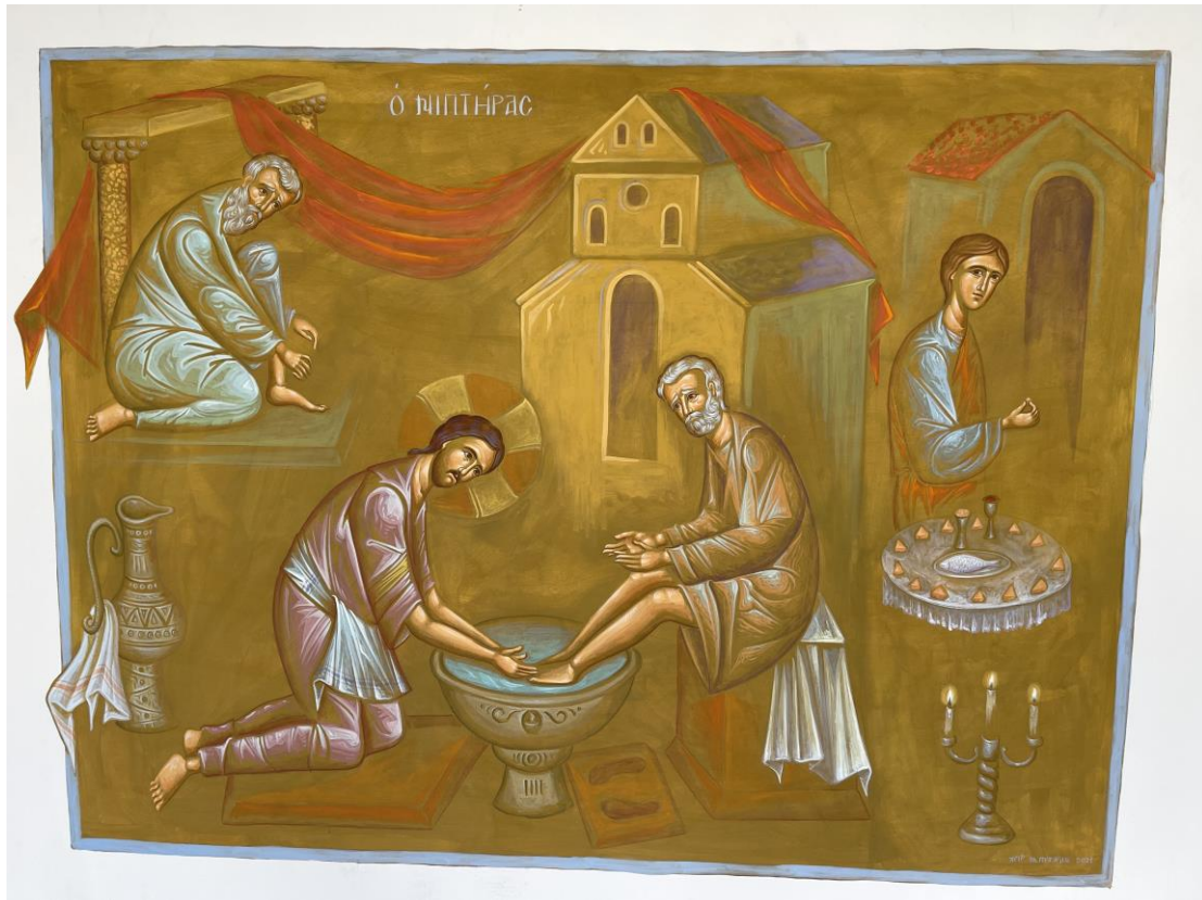
Η παράσταση του Νιπτήρα μπροστά από το Κεντρικό Αμφιθέατρο της Σχολής.