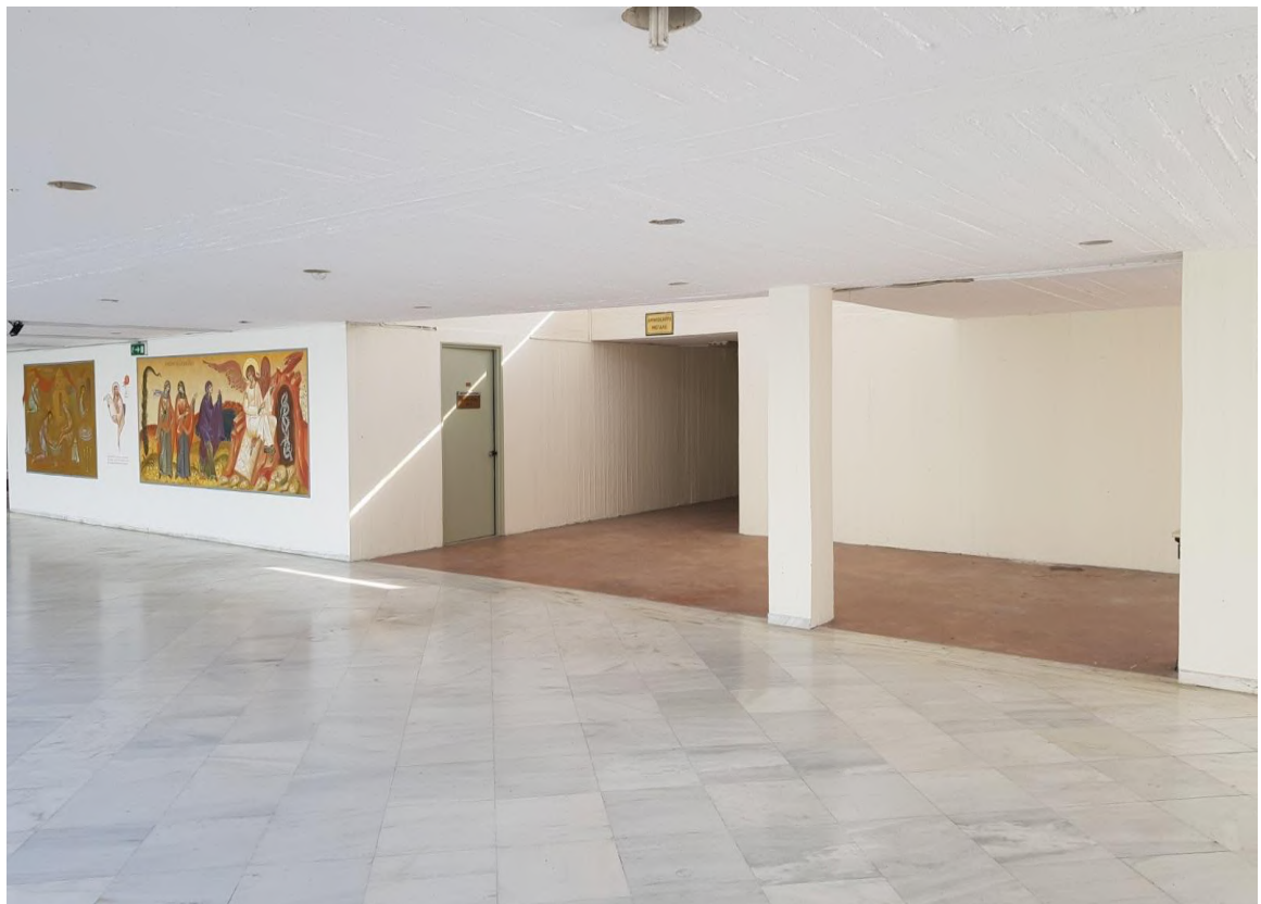
Ο πλήρως ανακαινισμένος χώρος μπροστά από το Κεντρικό Αμφιθέατρο.