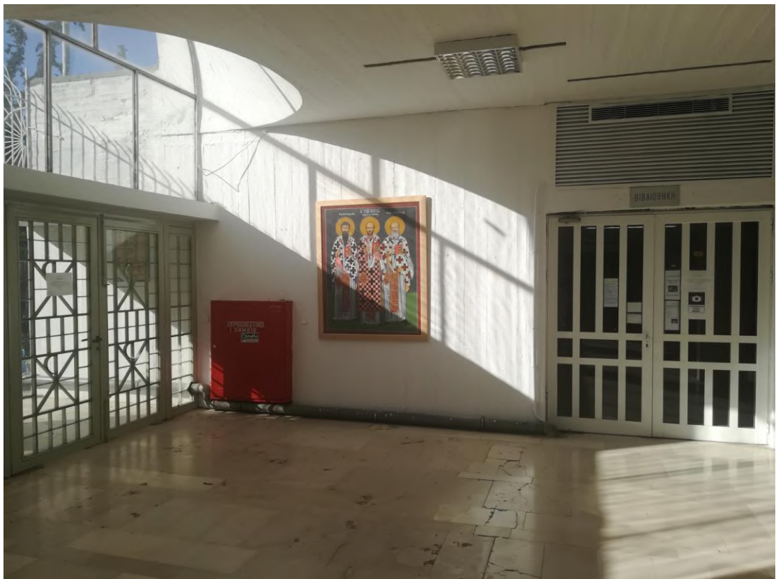
Η ίδια επιφάνεια κοσμεύεται με τους Τρεις Ιεράρχες ΤΩΡΑ.