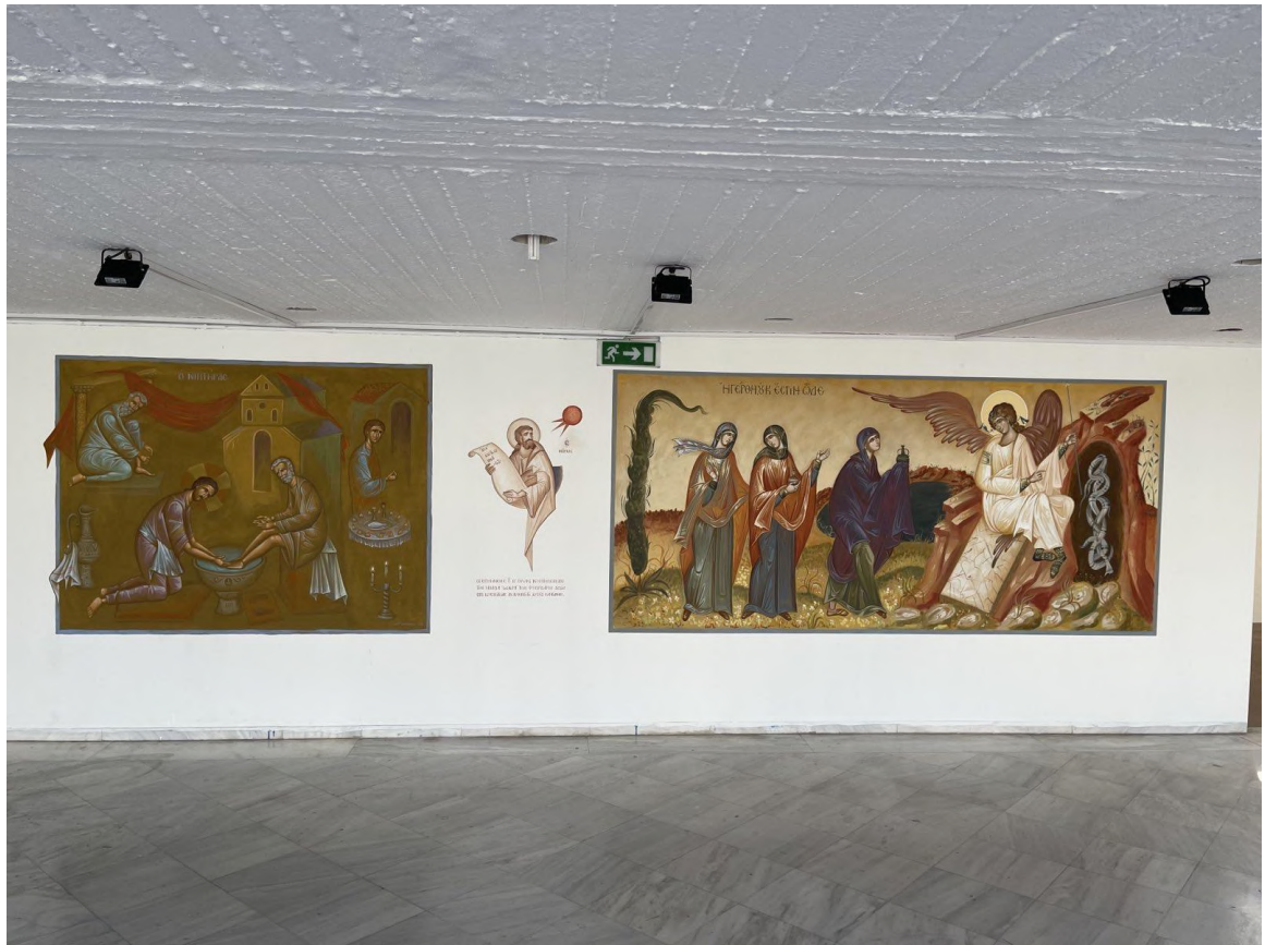
Η μεγάλη επιφάνεια μπροστά από το Κεντρικό Αμφιθέατρο ολοκληρωμένη.