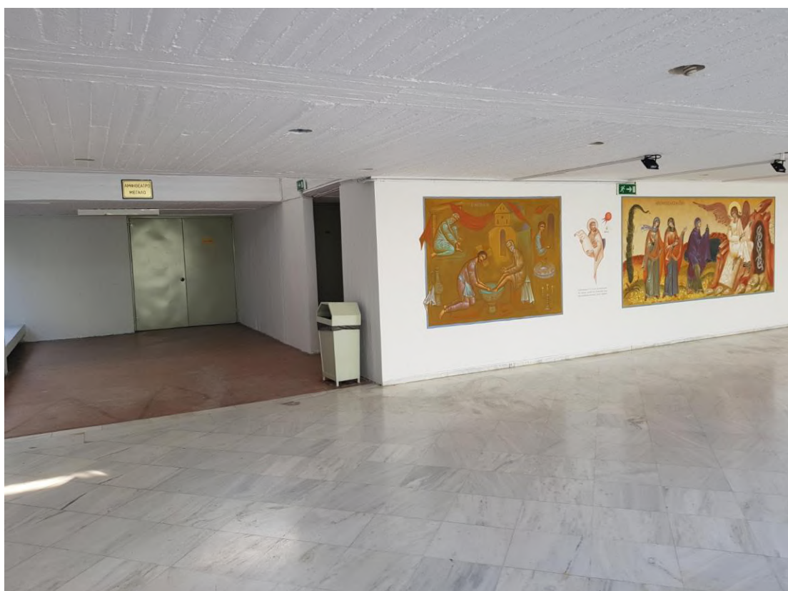
Η είσοδος στο Κεντρικό Αμφιθέατρο ΤΩΡΑ.